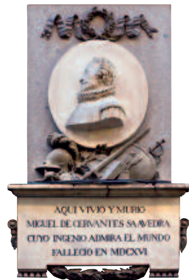
Aquí vivió y murió Miguel de Cervantes Saavedra cuyo ingenio admira el mundo (...)