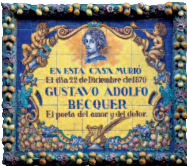
En esta casa murió el día 22 de diciembre de 1870 Gustavo Adolfo Bécquer (...)

Mira estas placas. ¿Puedes leer los textos? ¿Qué tiempo verbal se utiliza? ¿Por qué?